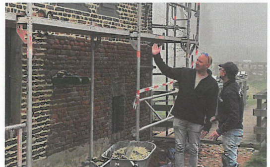
Overleg tussen de voegers van de Firma Haans uit Buggenum.